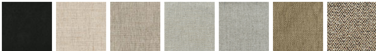
B932 B714 B713 B520 B530 B401 B721