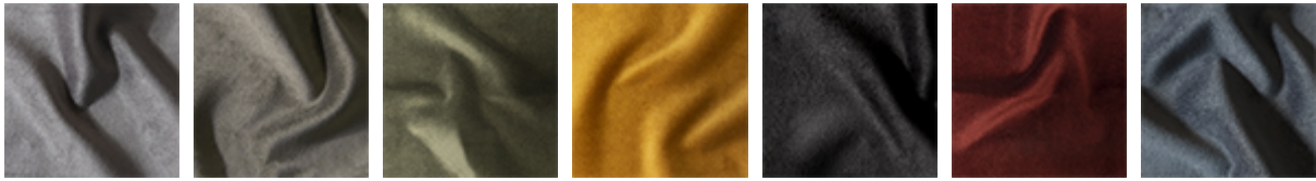
B232 B233 B234 B235 B236 B238 B239