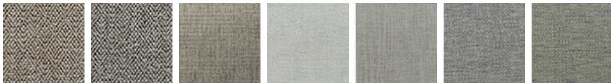
B720 B722 B403 B420 B521 B710 B711