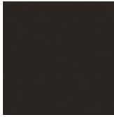
891 TESTA DI MORO