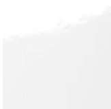
laminato bianco lucido