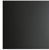
OP69 graphite opaco