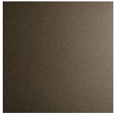
GFM11 goffrato titanio