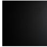
OP17 nero opaco