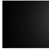
OP17 nero opaco