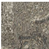
cotone ciriglià Chennai