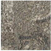
cotone ciniglia Chennai