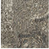
cotone ciriglia Chennai