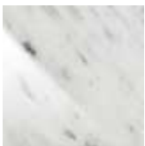
BC bianco Carrara lucido