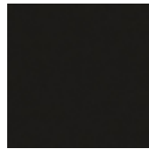
91 TESTA DI MORO