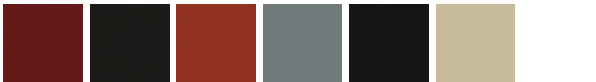
89 ROSSO CORSA 91 TESTA DI MORO 92 LOBSTER 93 ARTICHO 95 BLUE OCEANO 97 PANNA