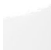
L7 laccato bianco lucido