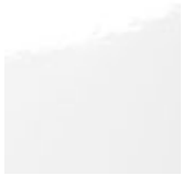
L7 laccato bianco lucido