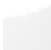
L7 laccato bianco lucido