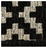
cotone ciniglia nero Halibut