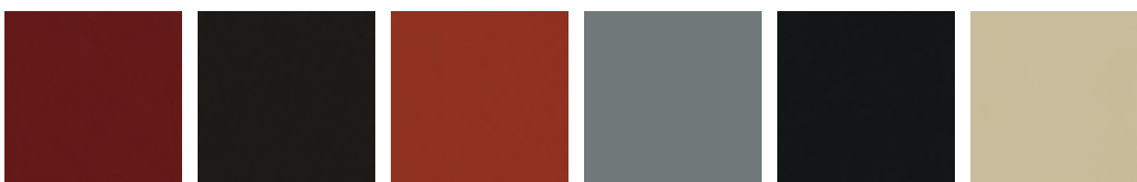
89 ROSSO CORSA