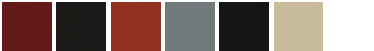
89 ROSSO CORSA 91 TESTA DI MORO 92 LOBSTER 93 ARTICHOKE 95 BLUE OCEANO 97 PANNA