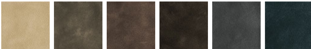
SN01 ZENZERO SN03 ARGILLA SN04 TERRA SN05 VISIONE SN06 VULCANO SN17 NOTTE