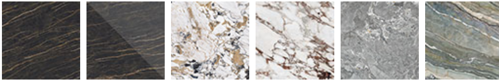
KM07 Portoro opaco