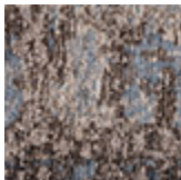
cotone cimiglia Radja