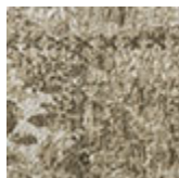
cotone cimiglia Jaipur