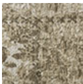
cotone ciniglia Jaipur