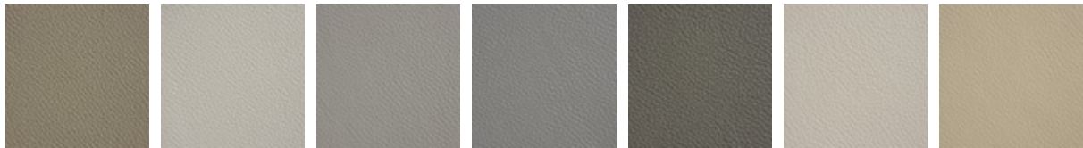
951 CASTORO 993 ARTICO 938 DAKOTA 995 NARDÒ 983 ARGILLA 948 LINO 969 CASHMERE