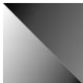
graphite extra chiaro