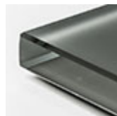
graphite extra chiaro acidato