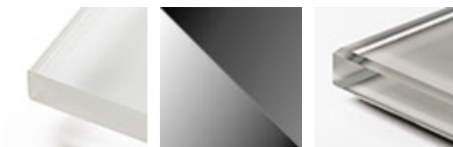
bianco extra chiaro