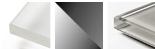
bianco extra chiaro