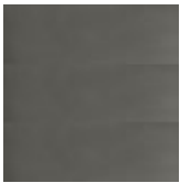
OPO verniciato trasmesso