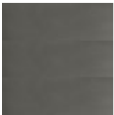
OPO verniciato trasparente