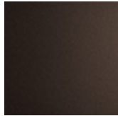
GFM18 goffrato bronzo