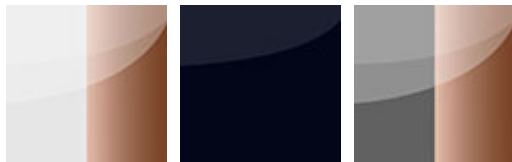
bianco - bronzo