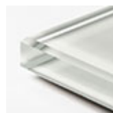
oyster extra chiaro