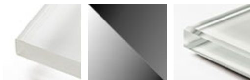
bianco extra chiaro