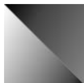
graphite extra chiaro