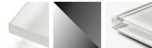
bianco extra chiaro