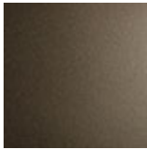
GFM11 goffrato titanio