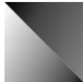
trasparente extrachiario bisellato