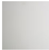
OP71 bianco opaco