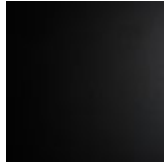
OP17 nero opaco