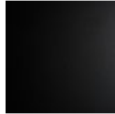
OP17 nero opaco