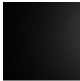
OP17 nero opaco