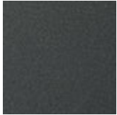
GF69 goffrato graphite