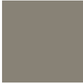
OP30 grey opaco