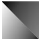
graphite extra chiaro