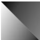
graphite extra chiaro