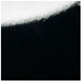
L3 laccato nero lucido