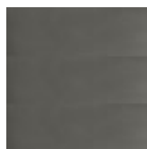
OP0 verniciato trasparente