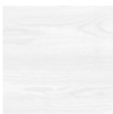
fr71 frassino laccato poro aperto bianco