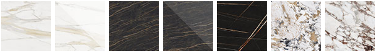
KM05 Golden Calacatta opaco