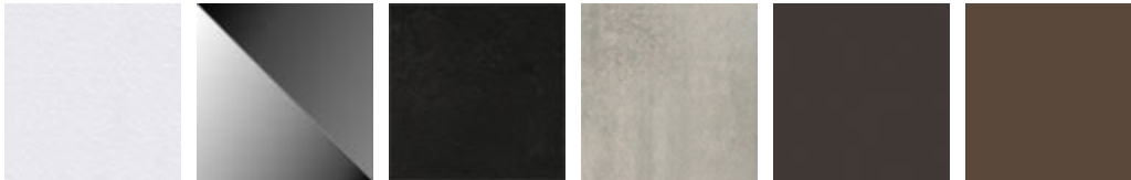
LM02 bianco climb