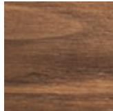
NC noce canaletto