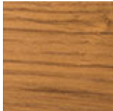
HR rovere Heritage