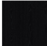
R73 rovere tinto nero opaco poro aperto