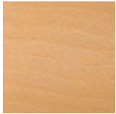
F1 faggio tinto naturale