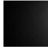
OP17 nero opaco