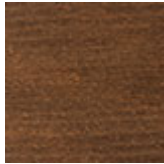
FNC faggio tinto noce canaletto