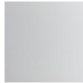
GFM71 goffrato bianco