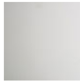
OP71 bianco opaco