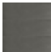
OP0 verniciato trasparente