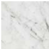
BCO bianco Carrara opaco