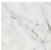
BCO bianco Carrara opaco