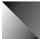
trasparente extrachiario bisellato