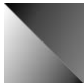
trasparente extrachiario bisellato