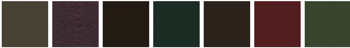
983 ARGILLA 984 BRONZO 985 RESINA 987 SHERWOOD 988 TABACCO 989 ROSSO CORSA 990 SALVIA