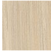
LM04 olmo bianco