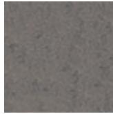
LM03 porfido grigio