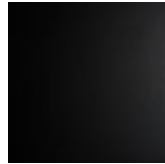
OP17 nero opaco