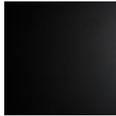
OP17 nero opaco