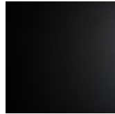
OP17 nero opaco