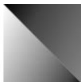
graphite extra chiaro