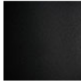
GFM73 goffrato nero