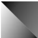
graphite extra chiaro