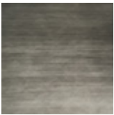
iron grey satinato