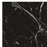
NM nero Marquinia lucido