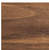
NC noce canaletto