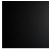
OP17 nero opaco