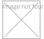
OLM73 Olmo tinto poro aperto nero opaco