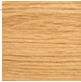
RN rovere naturale