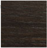
RB rovere bruciato