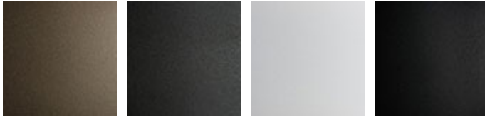
GFM11 goffrato titanio