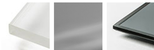
bianco extra chiaro