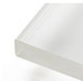
bianco extra chiaro