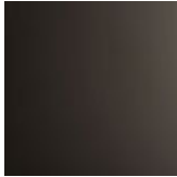
06 cromo nero