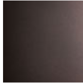
15 bronzo satinato